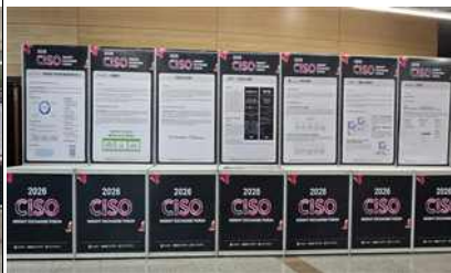
<설치 예시 2>