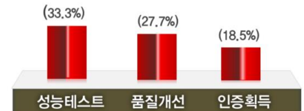
센터 주요 이용목적